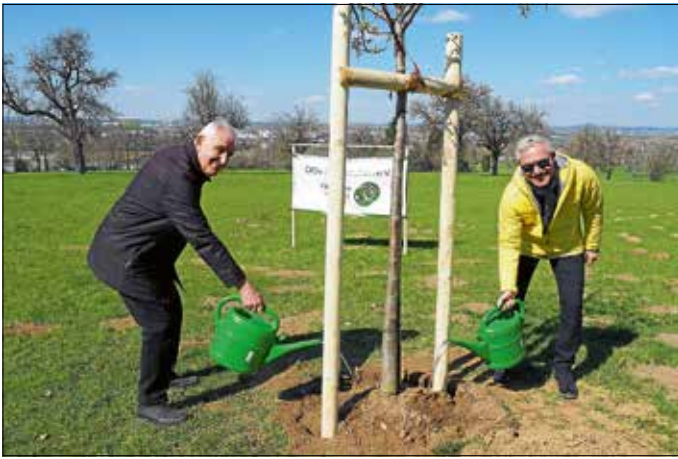
Am 18. Februar 1928 wurde der OGV gegründet und das ganze Jubiläumsjahr über gab es verschiedene Veranstaltungen.