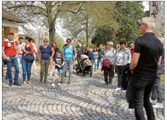
40 Interessierte beim Neubürgerrundgang: Start war wie in den Jahren vor Corona bei der evangelischen Kirche. Beim Rundgang durch den Ort gab es Einblicke und Ausblicke, Vereine und Kirchen stellten sich vor, außerdem gab es im Bürgertreff im Ostertagshof eine Kinderbetreuung und die Möglichkeit, Kontakte zu knüpfen.