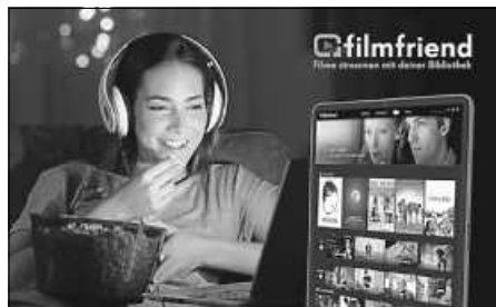
Plakat: Fa. filmwerte

Filmgenuss: Die Plattform filmfreund bietet mit über 3.500 Filmen Einblicke in die weite Welt des Films. Entwickelt von der Firma filmwerte GmbH aus Potsdam-Babelsberg, ermöglicht sie unseren Büchereikunden unbeschränkten Online-Zugang zu allen Filmen – kostenlos und werbefrei. Interessierte finden über das Angebot vor allem deutsche Filme, internationale, besonders europäische Arthouse-Titel, Filmklassiker, Kurzfilme, Serien und Dokumentarfilme, nicht zuletzt ein nicht minder kompetent kuratiertes Angebot für Kinder und Jugendliche. Somit gibt es ein aktives, filmkulturell sinnvolles Gegengewicht zum Überangebot von Filmen, die den Markt fluten. Glaubwürdig vermittelt und eingeordnet, erleichtern unter anderem spezielle Kollektionen den Überblick und somit die individuelle Entscheidung für einen Film.