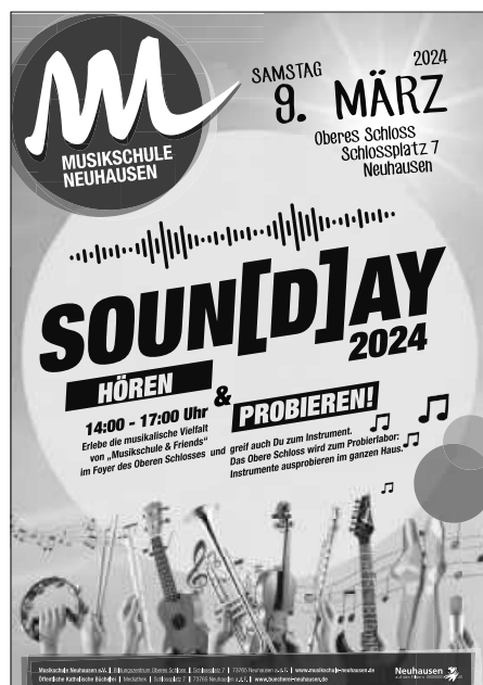
Plakat: Musikschule Neuhausen

Herzliche Einladung! SOUN(D)AY am 9. März 2024! Hören und Probieren!