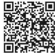
Code: Musikschule Neuhausen

Die Musikschule erhöht zum 1. April 2024 ihre Gebühren um ca. 5 %. Alle derzeitigen Schülerinnen und Schüler werden per Brief darüber informiert. Im Bereich frühe musikalische Bildung werden ab 1. April alle Kurse (MusiKnirpse 1 bis First steps) den gleichen Betrag kosten – 31 Euro. Somit erhöhen sich die Gebühren für die Kurse MK 1 und 2 auf 31 Euro. Die neue Gebührenordnung können Sie in der Musikschule einsehen bzw. zeitnah auf unserer Homepage ( www.musikschule-neuhausen.de ) nachlesen.