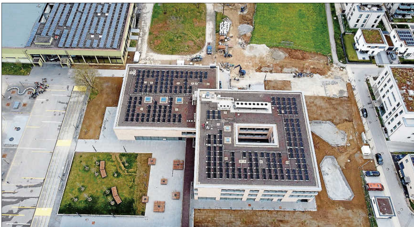
Blick über das neue Schulgebäude mit den Arbeiten an der Außenanlage

Seit dem Schuljahresbeginn im September 2023 ist die neue Anton-Walter-Schule mit der Mensa in Betrieb.