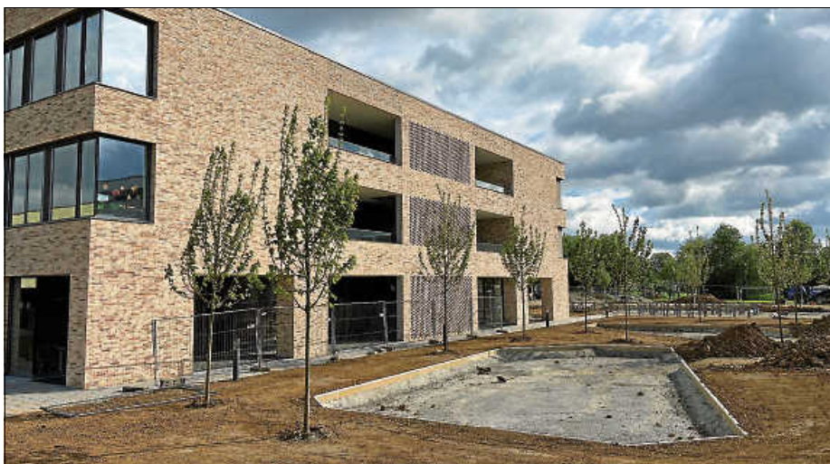
Außenanlage Südseite mit den Flächen für die Spielgeräte

Mittlerweile nehmen diese Gestalt an. Im gemeinsamen Eingangshof