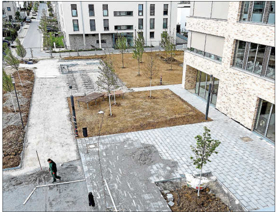
Blick über den neuen Schulhof Ostseite

Nach erfolgreicher Ansaat der Rasenflächen werden die Freianlagen voraussichtlich im Juli noch vor den Sommerferien fertiggestellt sein.